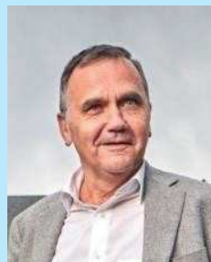
Benoît CEREXHE Bourgmestre Woluwe-St-Pierre