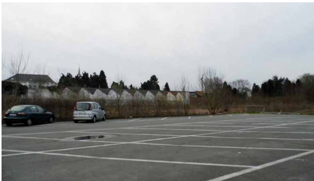
▲ Dit is de grond waarop het nieuwe politiekantoor zal gebouwd worden. Dit terrein ligt (letterlijk) op een steenworp van de huidige politiesite.