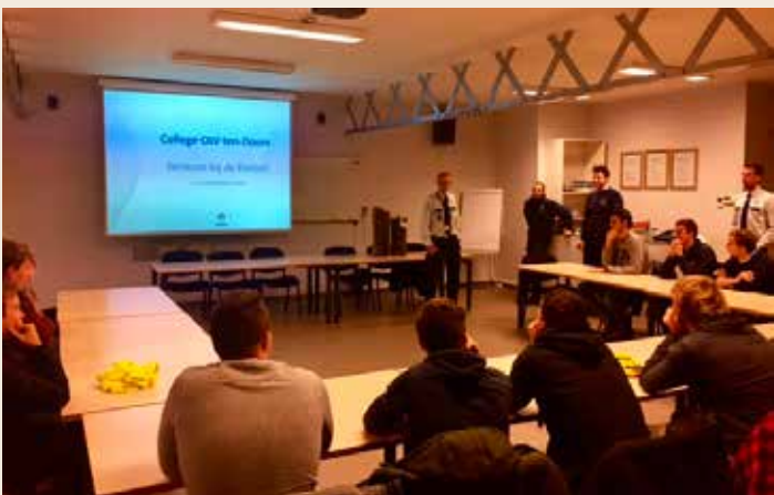
▲ De leerlingen luisterden aandachtig naar de uiteenzetting van onze politiemensen.

Op zaterdag 18 maart 2017 zal als vervolg aan dit event een infomoment worden georganiseerd voor het grote publiek. Meer informatie daarover zal binnenkort op de website van de politiezone en de rekruteringsdienst Jobpol worden verspreid.