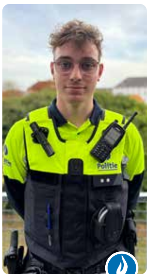
Matisse Cools interventie

We blijven verder sensibiliseren en ook de komende weken en maanden zullen er nog geregeld fietscontroles zijn.