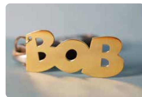
1 van de 30 gouden BOB-sleutelhangers