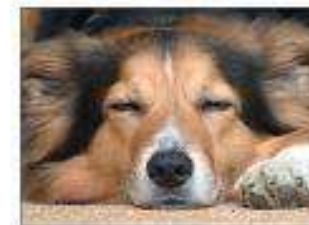
De beste vriend van de mens kan een bescherming bieden.