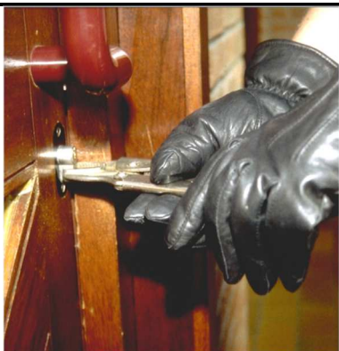
Een deur waar het cilinderslot uitsteekt is verleidelijk voor inbrekers