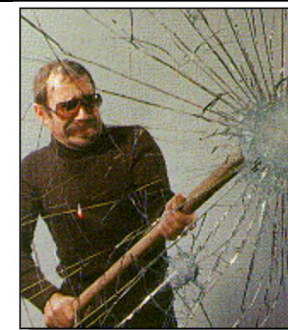
Gelaagd glas houdt de inbreker buiten. Het glas barst, maar breekt niet.