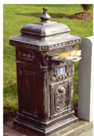
Geef uw woning een bewoonde indruk. Laat regelmatig de brievenbus leegmaken