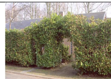
Hoe meer de woning verscholen gaat achter een groenafsluiting en/of een andere afsluiting, hoe minder sociale controle er kan zijn.