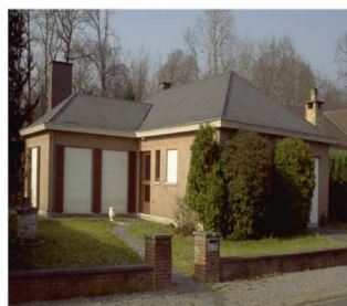
Geef uw woning een bewoonde indruk. Laat iemand uw rolluiken optrekken en laat eventueel een lichtje branden.