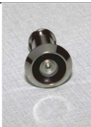
Een spionnetje in de deur is even doeltreffend als een camera.