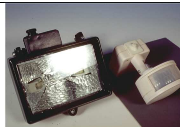
Een onbereikbare spot met sensor zet de inbrekers in het licht.