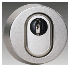
Een veiligheidsrozet over het slot, zonder schroeven aan de buitenzijde is een oplossing.