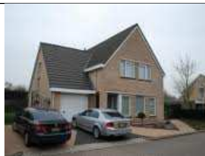
De auto wordt 's nachts beter binnen gezet.